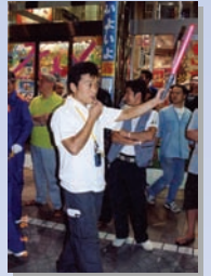
○ 「武蔵境祭り」の進行係を担当