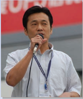
○ クールビズで街頭演説