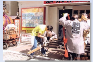
○ 杵築大社の秋祭り「子ども神輿」の準備