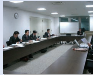
○ 会派予算要望作成に向けて各種団体ヒアリング