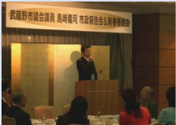
○ 毎年「市政報告会」を開催 しっかりと市民の声を聞く