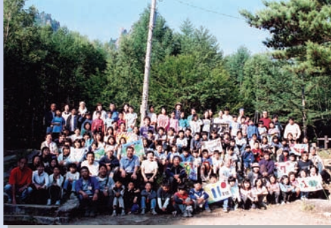
○ 青少協第二地区「武蔵野ジャンボリー」指導者として毎年参加