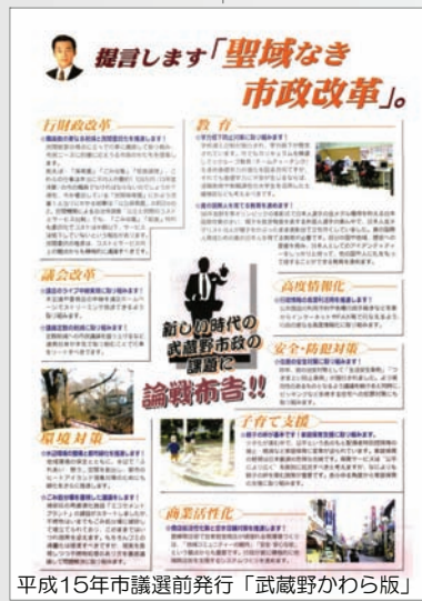
平成15年市議選前発行「武蔵野かわら版」

※邑上市長が提示した縮小案は、敷地内駐車場と4階部分を取り払い、青少年の居場所をなくしてしまうという、それまでの市民・議会・行政が8年間積み上げてきた議論を無視するものでした。