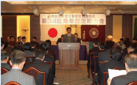
○ 第18代自民党三多摩支部連合会青年部長に就任