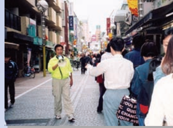
○ すきっぷ通り商店街恒例「大抽選会」の会場整理