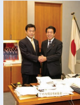
○ 下村博文内閣官房副長官を訪問