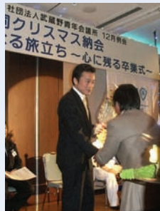
○ 副理事長、監事等を務めた(社)武蔵野青年会議所を2006年度卒業