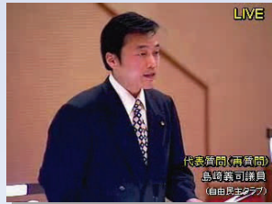
○ 会派を代表して「代表質問」